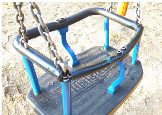
Zdjęcie z 31.07.2017 r.