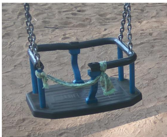
Zdjęcie z 09.07.2017 r.

Oso biście wystąpiłem do producenta o instrukcję serwisową, przeglądów i bieżącej konserwacji (przekazałem najważniejsze ustalenia w formie wcześniejszej interpelacji) – niestety nie wpłynęło to na konieczne zmiany w obsłudze i poprawę jakości placu i zapewnienie odpowiedniego poziomu bezpieczeństwa. Nadal podtrzymuję propozycję przeprowadzenia bezpłatnego szkolenia dla pracowników zajmujących się placem zabaw.